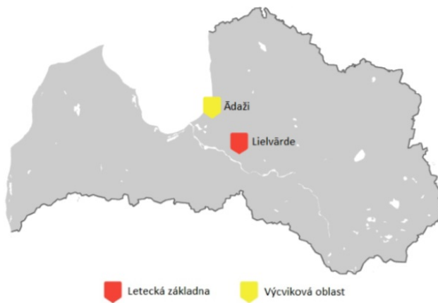
Mapa 9: Vojenské objekty zahrnuté v lotyšsko-americké smlouvě