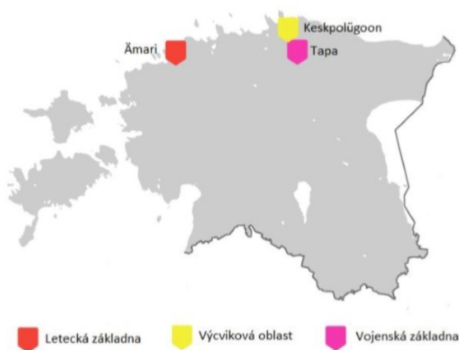
Mapa 7: Vojenské objekty zahrnuté v estonsko-americké smlouvě

V současnosti Spojené státy a další spojenci z NATO využívají několik základen, jejichž rozmístění a typologie je vidět na následujících mapách.