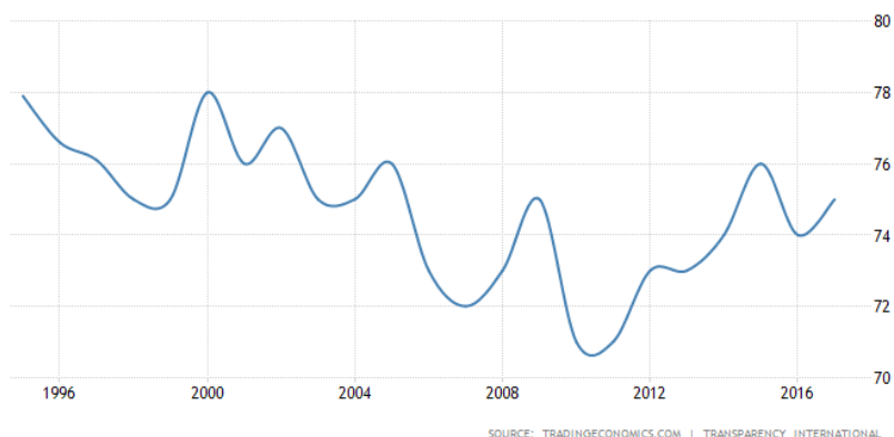
Obr. 1 - Corruption Perception Index, USA, vývoj v letech 1995 - 2017

nekalé způsoby ovlivňování politiků. Nicméně samotný zákon o lobbingu zdaleka nestačí k účinnému boji s korupcí. K tomu je potřeba upravit i další oblasti právního řádu.